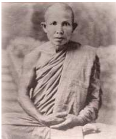
พระอาจารย์กงมา จิรปุณฺญ

เป็นที่พอใจ สอนคำภานาให้ว่า “พุทธโศฯ” เพียงคำเดียวเท่านั้น พอดีท่านกำลัง อาพาธ ท่านได้แนะนำให้ไปพักอยู่บ้านท่าวังหิน ซึ่งเป็นสถานที่เงียบสงัดวิเวก ดี ที่นั่นมีพระอาจารย์สิงห์ ขนดะยากโม พระอาจารย์มหาปิ่น ปญญาพล มี พระภิกษุสามเณรราว ๔๐ กว่าองค์พักอยู่ ได้เข้าไปฟังธรรมเทศนาของท่านทุก ค่ำ รู้สึกว่ามีผลเกิดขึ้นในใจ ๒ อย่างคือ เมื่อนึกถึงเรื่องเก่าๆ ของตนที่เป็นมาก็ ร้อนใจ เมื่อนึกถึงเรื่องใหม่ๆ ที่กำลังประสบอยู่ก็เย็นใจ ทั้ง ๒ อารมณ์นี้ติดตน อยู่เสมอ