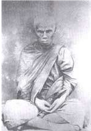
พระอมราริกขิต (เกิด อมโร)

วันหนึ่งเวลากลางคืนนอนหงายดูหนังสือพร้อมภรรยา พอเคลิ้มหลับได้เห็นพระอาจารย์มั่น ภูริทัตโต มาดูว่า “ท่าน อยู่ทำไมในกรุงเทพฯ ไม่ออกไปอยู่ป่า” ก็ได้ตอบท่านว่า “พระอุปัชฌาย์ไม่ยอมให้ไป” ท่านตอบคำเดียวว่า “ไป” จึงได้ตั้งจิตอธิษฐานถึงท่านว่า “เมื่อออกพรรษาแล้ว ขอให้ท่านมาโปรดเราเอาไปให้จงได้”